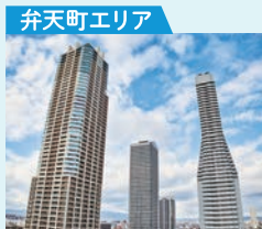
弁天町エリア 徒歩で約1分