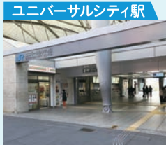
ユニバーサルシティ駅 電車で約10分

市バスご利用の場合 51号、84号 弁天町駅前 下車50m 60号、88号 市岡バス停下車 北へ700m