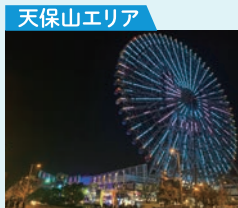
天保山エリア 電車で約5分