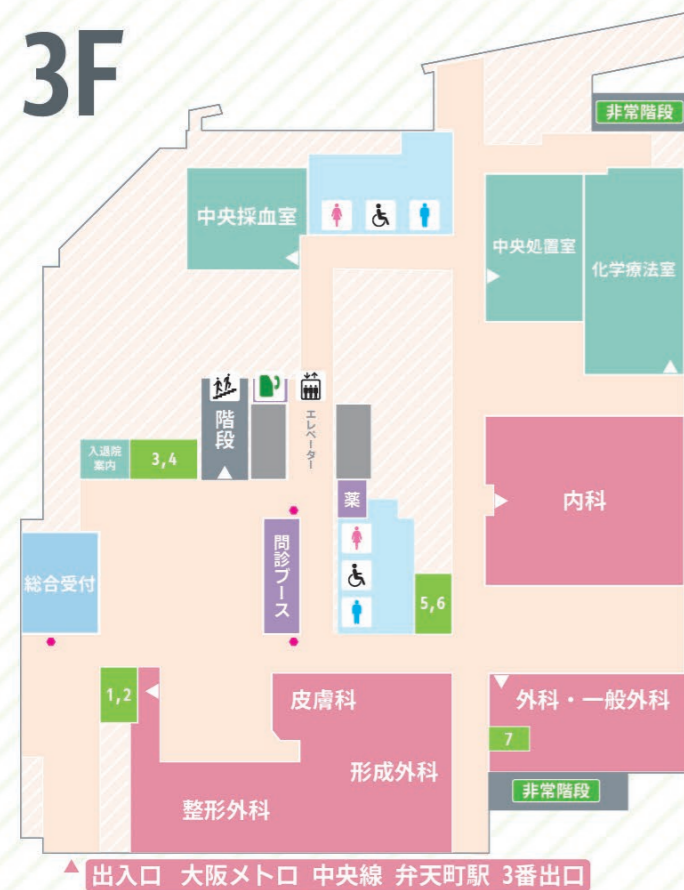
総合受付 [1] 初診受付・[2] 保険証確認 [3] 書類受付・[4] 伝票受付・[5] 会計 入退院案内 出入口 (大阪メトロ弁天町駅) ● 再来機 ■ 相談室 1~7 中央処置室 中央採血室 化学療法室 内科 形成外科 皮膚科 外科・一般外科 整形外科