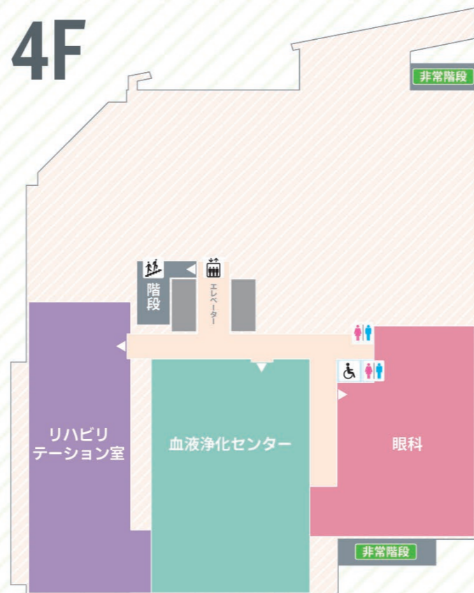
眼科 血液浄化センター リハビリテーション室