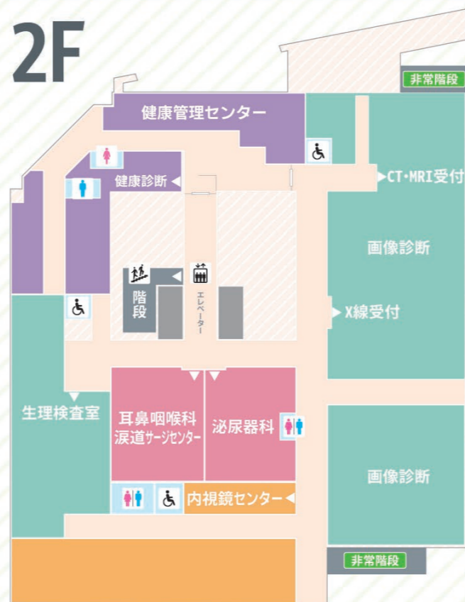
耳鼻咽喉科・涙道サージセンター 泌尿器科 内視鏡センター 健康管理センター (健康診断) 画像診断 X線・CT・MRI室・血管造影室 マンモグラフィー検査室・透視撮影室 生理検査室 超音波 (エコー) 室・心電図室 脳波室・眼底検査室