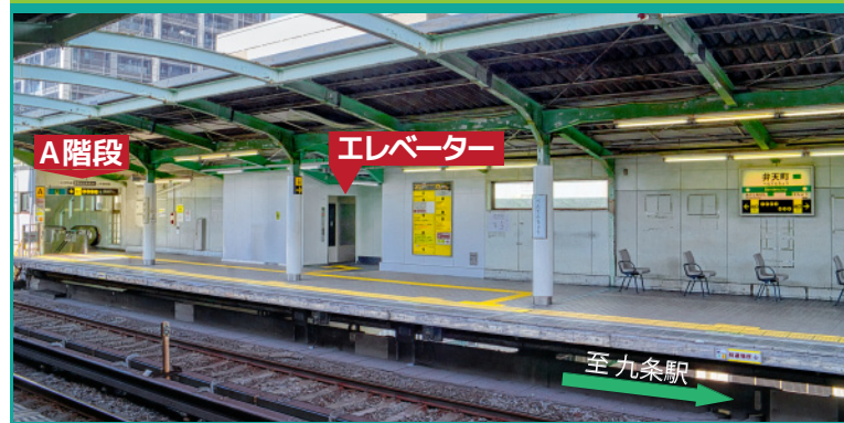
長田・学研奈良登美ヶ丘方面ホーム