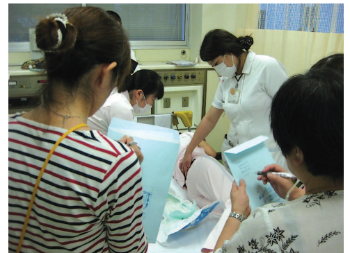
【褥瘡対策セミナー風景】

入院中に褥瘡ができないよう、スキンケア、マットレスの調整、栄養管理などの取り組みを医師、看護師、薬剤師、栄養士などのチームで行っています。また、地域の医療・介護スタッフとも連携するため、「褥瘡対策セミナー」を開催しています。これまで、「おむつのケア」「体圧分散ケア」「褥瘡の治療：薬剤、ドレッシング剤の選択」などのテーマで開催し好評です。皆さま“スキンケア”ってご存知ですか？高齢者の皮膚は薄くもろい特徴があります。手や足をぶついたり、移動の際に介助者が腕をつかむことでもできてしまうことがあります。スキンケアはとても痛みを伴う創です。予防のケアとして、毎日保湿をし保護することが大事になってきます。スキンケアのようなトピック的テーマも取り入れて地域の医療・介護スタッフとともにスキントラブルや褥瘡の予防ケアの質向上を行っています。