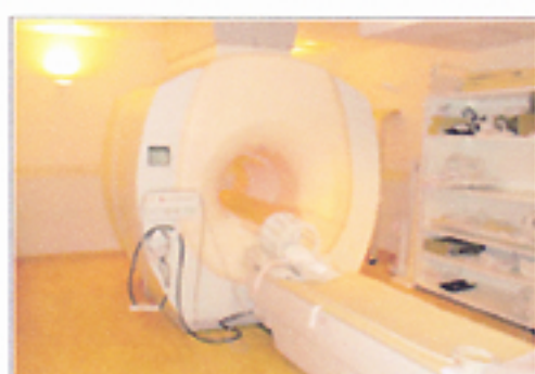
オランダ フィリップ社製 Achieva